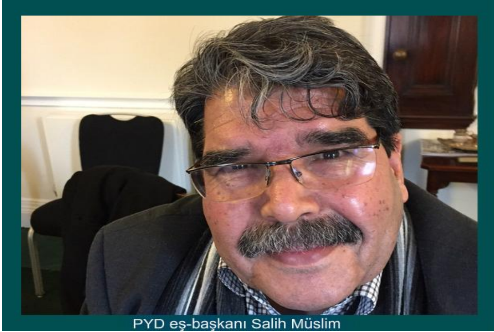
PYD eş-başkanı Salih Müslim

Kürtlerle dayanışmak için bir gösteri düzenleyebiliriz. Ama biz o mücadelenin bir parçası olmak istemiyoruz.” sözleriyle ifade etmiştir. 5 Partinin eş-başkanı Salih Müslim de 2011’de Kurdwatch adlı siteye verdiği röportajda “Bizim Suriye’de dil kurslarımız ve kültür merkezlerimiz vardır, Türkiye’de yoktur. Ama bizim Suriye’de Apo’nun felsefe ve ideolojisine başvurmamızın bir sebebi vardır: O felsefe ve ideoloji, Suriye Kürdistan’ında Kürt probleminin çözümü için en iyi çözümü ortaya koymaktadır. Fakat biz asla dışarıdan bir yerlerden emirler almayız.” demiştir. 6